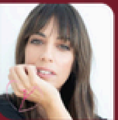
Almudena Cid, Campeona de España de Gimnasia Rítmica