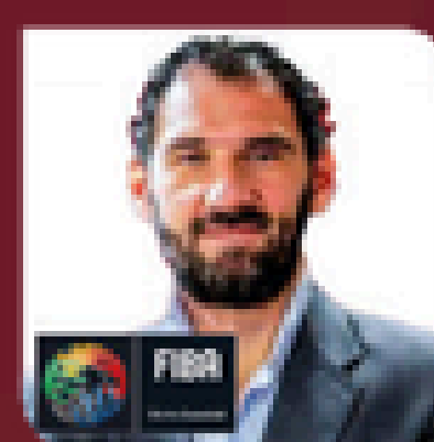
Jorge Garbajosa, Presidente de FIBA Europe